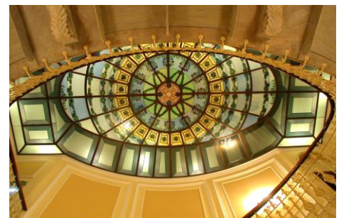
Immagine 2 – Genova: Occhio 2002 verso il cielo

Immagine 1- René Magritte - The False Mirror (1928)